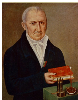
Figura 3 – Volta com sua pilha e seu eletróforo.