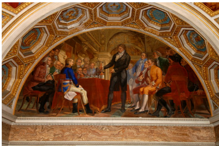
Figura 4 – Volta apresenta a pilha para Napoleão Bonaparte, por Gaspero Martellini.