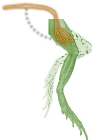
Figura 5 - O sapo ambíguo: condensador orgânico ou eletromotor físico?

Ambos estudiosos estavam diante de uma mesma situação. Todavia, como ressalta Hanson (1975, p.130): "são as pessoas que vêem e não seus olhos". Os pressupostos de cada estudioso, sua influência biográfica e psicológica, os levou a observar o mesmo sapo sob óticas distintas; uma voltada à eletrobiologia e outra à eletrofísica. Como o próprio Galvani (1841, p.322) salienta: "Quem pode deixar de ver que ambos estamos dizendo o mesmo, embora com palavras diferentes?"