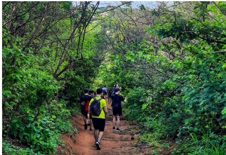
Figura 3: Estudantes durante Trekking na Trilha dos Bastiões

Para o aluno Mountain Bike, “a prática do Trekking não é apenas caminhar em uma trilha, também é sobre viver o momento da trilha”. Nesse sentido, o relato nos leva a compreender que a vivência do Trekking em ambientes naturais, para além das possibilidades de ensino da própria modalidade e das questões relacionadas ao meio ambiente e riscos, permite que os estudantes aprendam e ainda possam usufruir das experiências sensoriais que os espaços naturais proporcionam, aspecto que também pode ser visualizado na Figura 3.