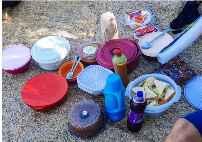
Figura 4: Momento do café comunitário

Atrelado aos aspectos de contemplação da natureza, trazemos à tona outro fator considerado motivador relacionado aos espaços não formais de educação, mas que também pode ser entendido como uma possibilidade de ensino da aventura mencionada pelo aluno Windsurfe: “Vimos a paisagem linda de lá e fizemos um café comunitário”.