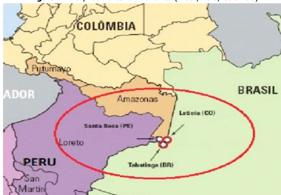
Figura 1: A tríplice fronteira amazônica (Brasil, Peru, Colômbia)