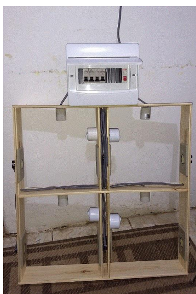
Figura 6. Ambiente controlado em fase de construção

Serão desenvolvidos os protótipos contendo sensores de medição de corrente elétrica e um dispositivo que faz a conexão com a internet e envia os dados para um servidor com certo intervalo programável.