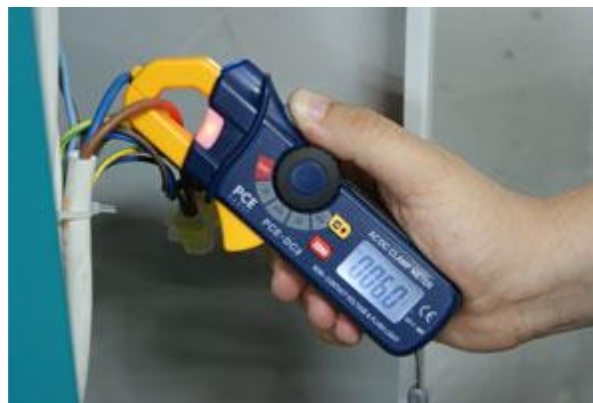
Figura 1. Imagem alicate voltamperímetro