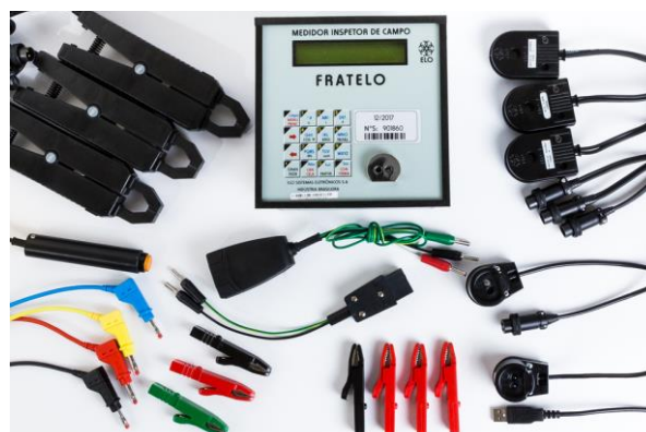
Figura 2. FRATELO, medidor de aferição em campo