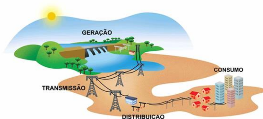
Figura 4. Distribuição de energia através de redes - ABRADEE.

Conhecer o seu consumo e a possibilidade de monitoramento em tempo real, é um recurso contra um novo comportamento por parte das distribuidoras de energia, outrora utilizado em consumidores de alta tensão, agora também em consumidores domésticos, com foco principalmente na arrecadação e no controle da demanda em horários de pico 8 , independente do porte.